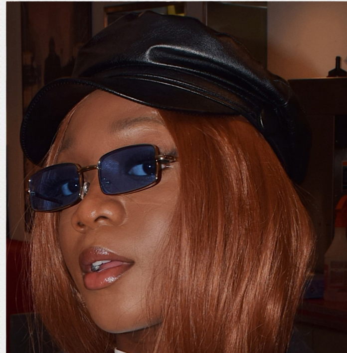
Eliada Soboth Mannequin