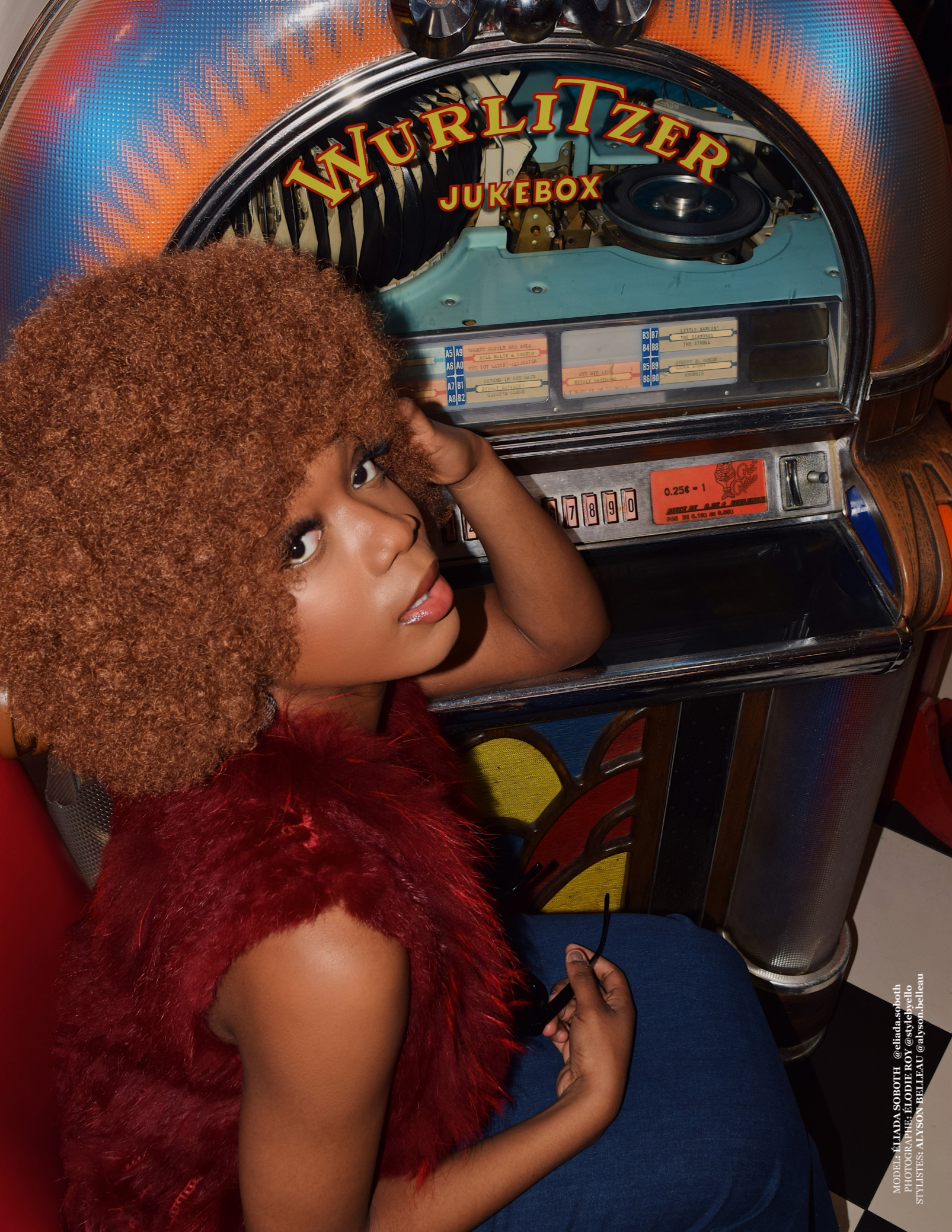
MODEL: ELIADA SOBOTH @eliada.soboth STYLISTES: ALYSON BELLEAU @alyson.belleau